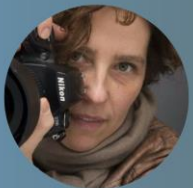
ISABELLE MORISON PHOTOGRAPHE D'ENTREPRISE