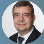
PIERRE BRESSE EXPERT PROPRIÉTÉ INDUSTRIELLE