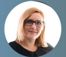
CARINE PERDRIGÉ COMMUNICATION ET IDENTITÉ VISUELLE